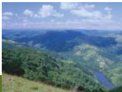
Vue sur les Gorges du Lot