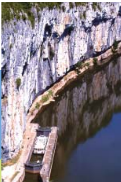
Ecluse de Bouziès