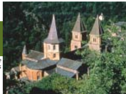
Abbatiale de Conques