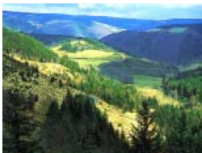
Aux sources du Lot

Pour la période 2000-2006, une convention interrégionale d'un montant de près de 112 millions d'Euros (734MF) a été signée, cofinancée par l'Etat, l'Europe, les régions et les départements.