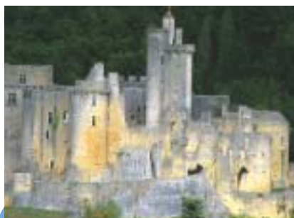
Château de Bonaguil